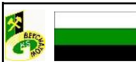
TABELA WYNIKÓW – FAZA WSTĘPNA (ELIMINACJE)

Turniej „BEŁCHATÓW CUP 2014” [rocznik 2006 i młodszy]